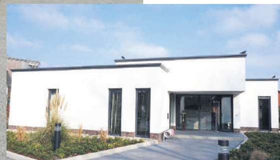
Bürogebäude der Hanekamp GmbH in Lorup