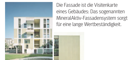
Die Fassade ist die Visitenkarte eines Gebäudes: Das sogenannte MineralAktiv-Fassadensystem sorgt für eine lange Wertbeständigkeit.