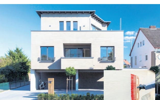
Auch außergewöhnliche Gestaltungstechniken sind für Hanekamp kein Problem: Hier wurde ein rauer Besenstrich-Strukturputz angewandt, der eine einzigartige Oberflächenstruktur schafft.