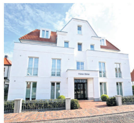
Wärmedämmverbundsystem mit aufgesetzten Stuckelementen