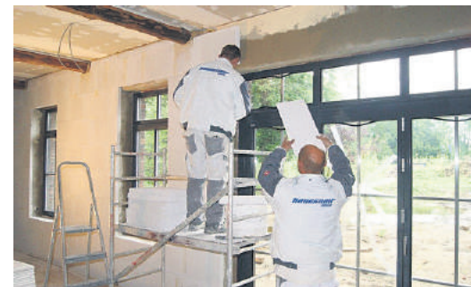
Für denkmalgeschützte Gebäude bietet sich auch ein mineralisches Innendämm-System an – dieses spart Heizenergie und sorgt für ein angenehmes Wohnklima.