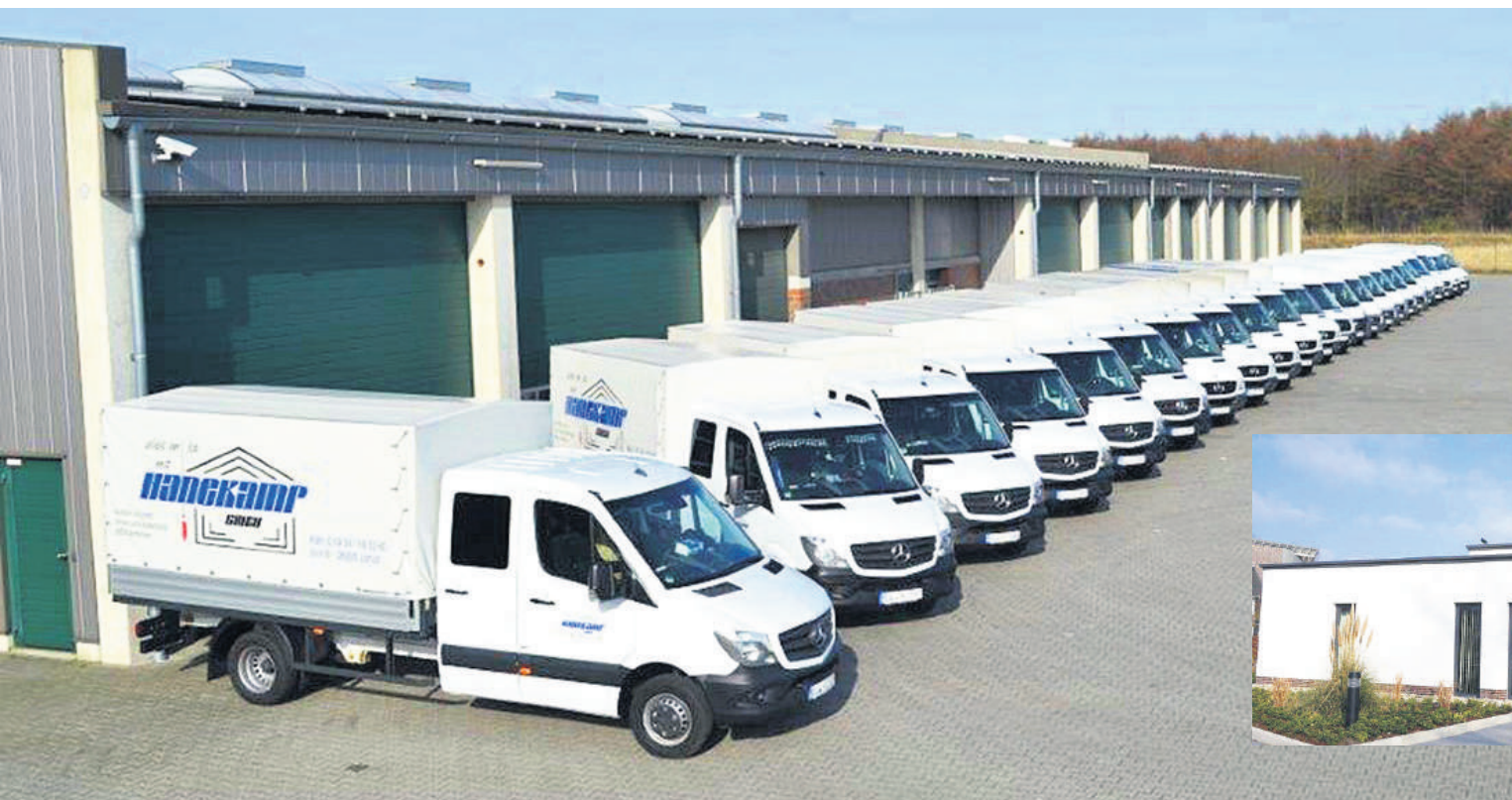
Moderner Fuhrpark mit 23 eigenen Kolonnen