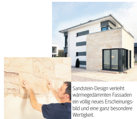
Sandstein-Design verleiht wärmedämmten Fassaden ein völlig neues Erscheinungsbild und eine ganz besondere Wertigkeit.