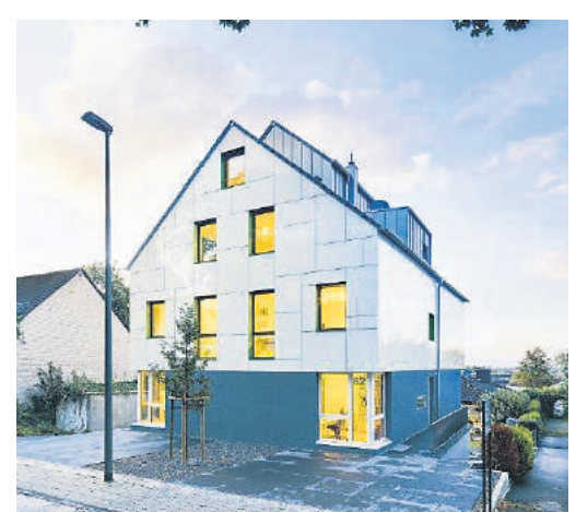
Wärmedämmverbundsystem mit Oberbelag aus Glas