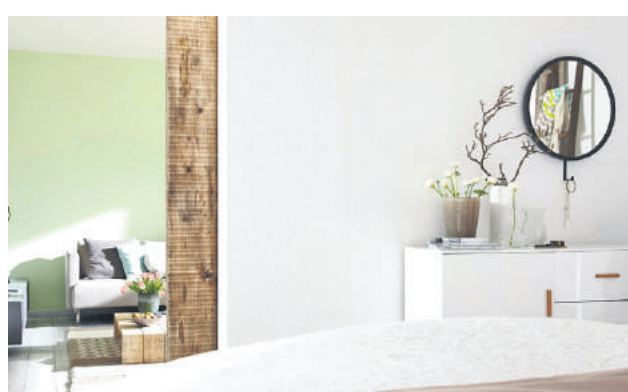
Der Loruper Spezialist für Innen- und Außenputzarbeiten wendet auch reine Kalk- oder Lehmputze an, die besonders feuchtigkeitsregulierend sind.